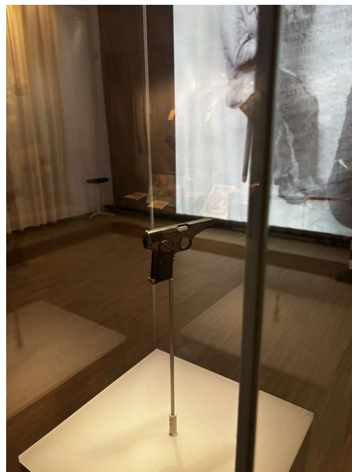
Pistolet utilisé pendant l'attentat de Sarajevo qui a déclenché la première guerre mondiale en 1914

Les événements qui ont conduits l'Europe à sa construction sont la première et la seconde guerre mondiale.